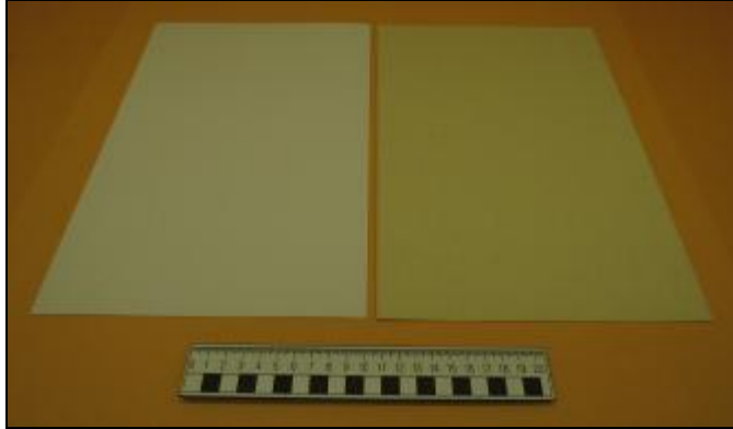
Nº 3: 735 - Reverso madera