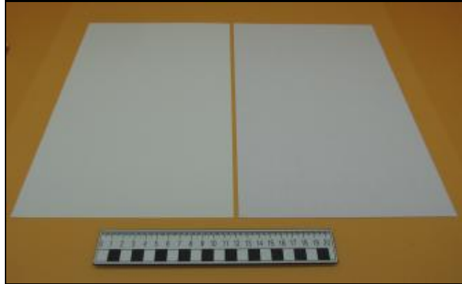
Nº 7: 727 - Roble blanco