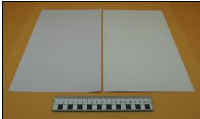
Nº 2: 716 - Reverso blanco