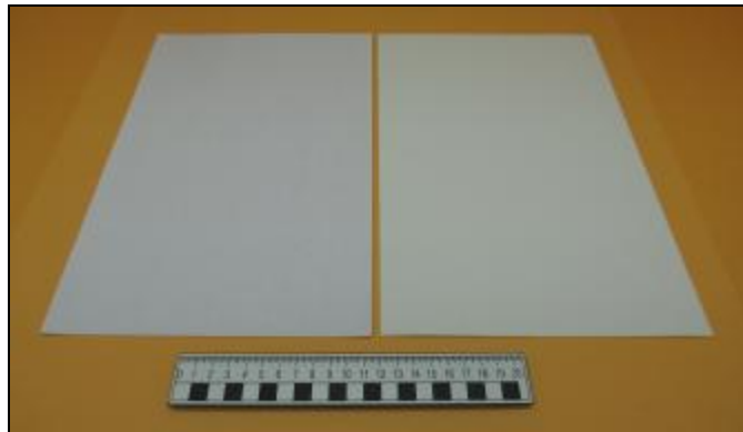
Nº 6: 717 - Reverso madera