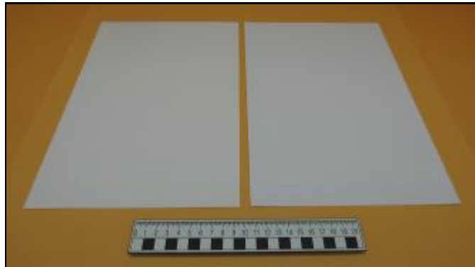
Nº 8: 730 - Cartulina Ibiza