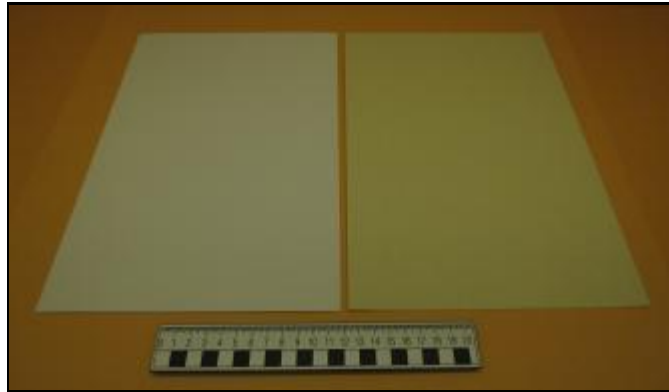
Nº 5: 713 - Reverso blanco